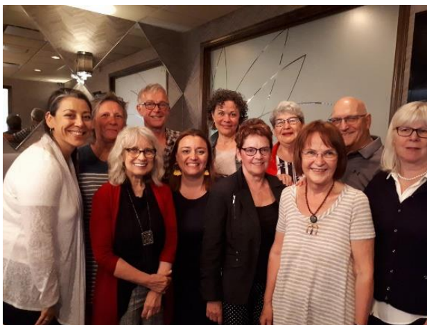
Photo lors de la remise des attestations

La formation 36 heures du printemps s'est terminée en juin 2019. Les 14 participants de ce groupe ont été animés d'une volonté à partager entre eux et avec les formateurs leurs questionnements, commentaires et expériences. De ce groupe, sept personnes sont maintenant bénévoles et une personne est devenue formateur.